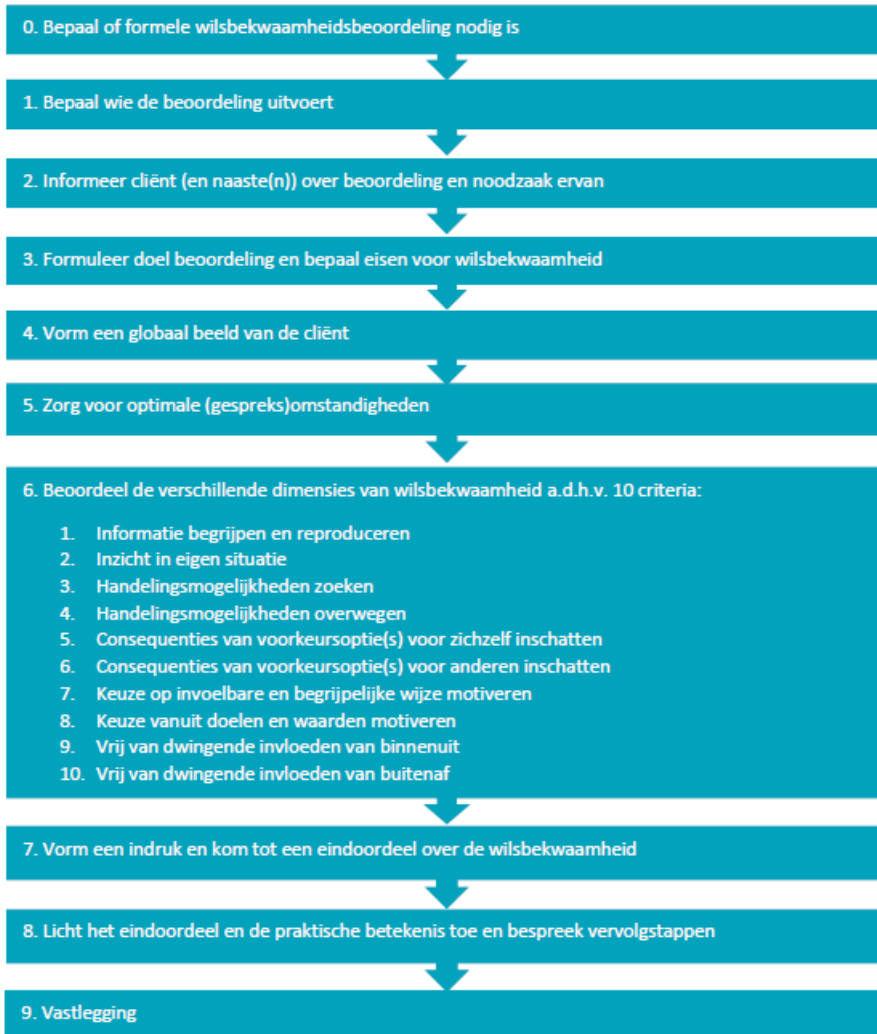
Figuur 6.1: Stappenplan formele wilsbekwaamheidsbeoordeling