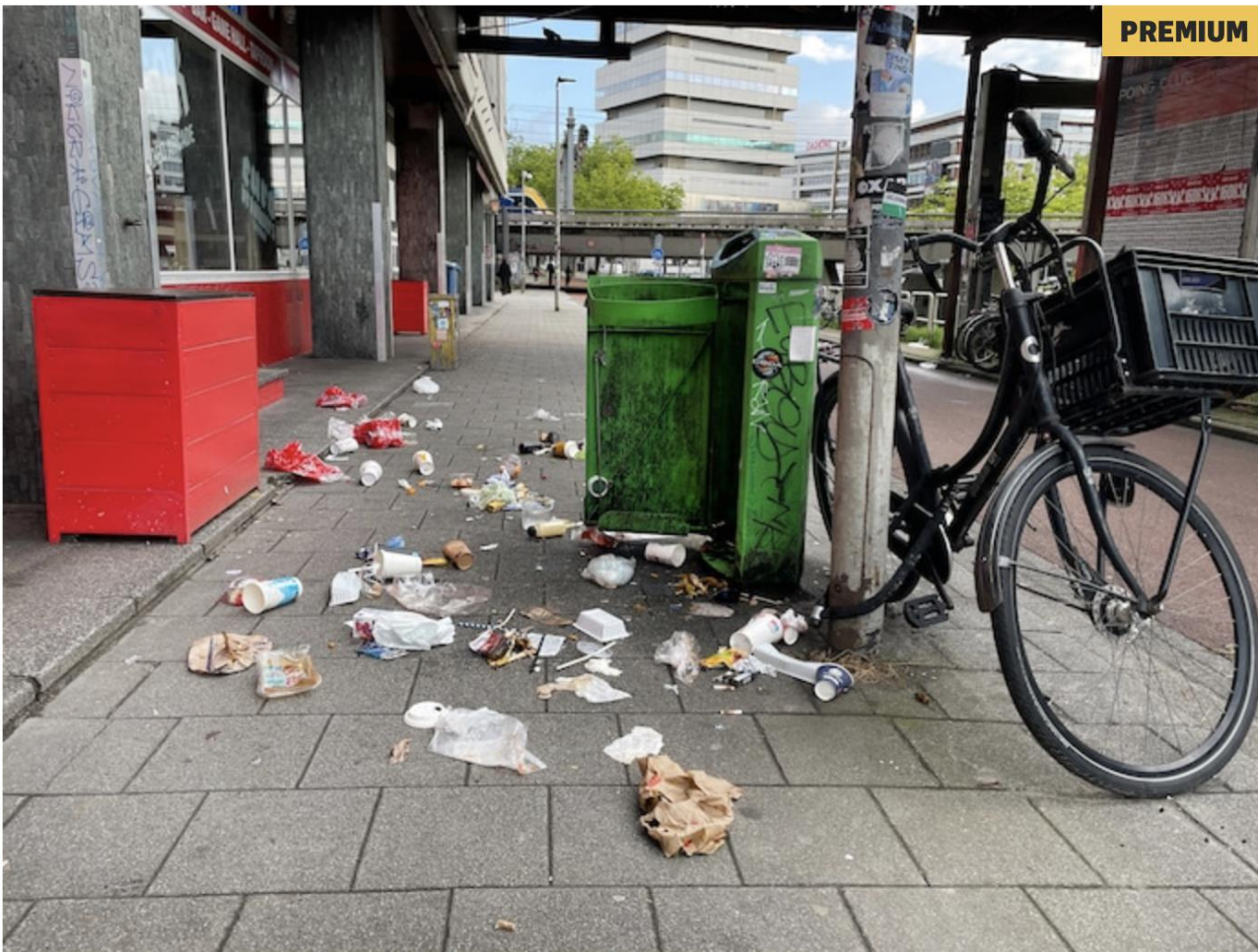
▲ Afval op straat in Rotterdam.